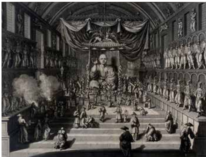
“Temple du Japon ou il y a mille idoles” Ceremonies et coutumes religieuses... A Amsterdam: chez Jean Frederic Bernard, 1728

Asimismo, en sus caminos por las Indias Orientales, los navegantes y viajeros occidentales fueron recogiendo informaciones sobre las tierras y los mares que iban explorando. Gracias a estos datos se fue conformando un nuevo saber geográfico que permitió la configuración de mapas cada vez más precisos y detallados. El desarrollo de la cartografía posibilitó que Asia Oriental fuese cobrando ante los ojos de Europa una forma cada vez más real y definida. Durante la Edad Moderna se editaron numerosos atlas y libros de mapas donde el oficio de la imprenta y el arte del grabado posibilitaron una mejor y más amplia comprensión de estos territorios.